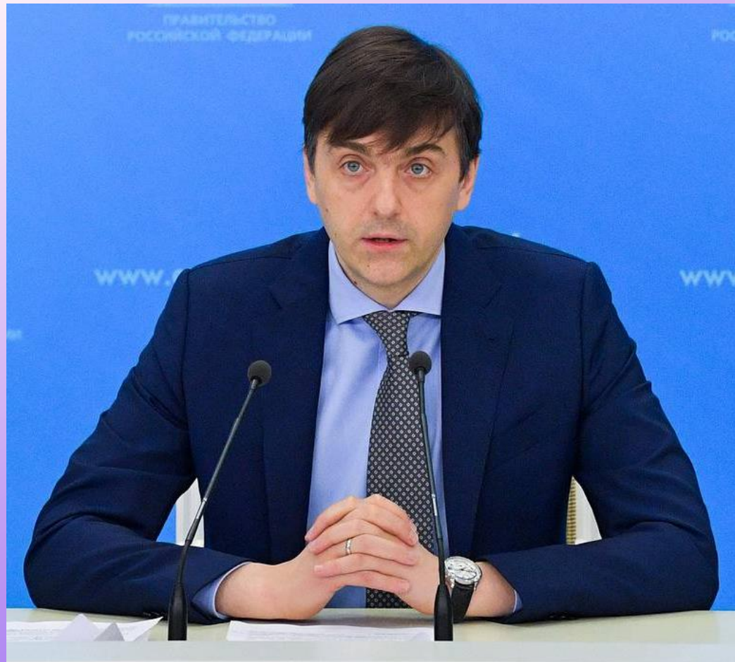
Министр просвещения России, Кравцов Сергей Сергеевич