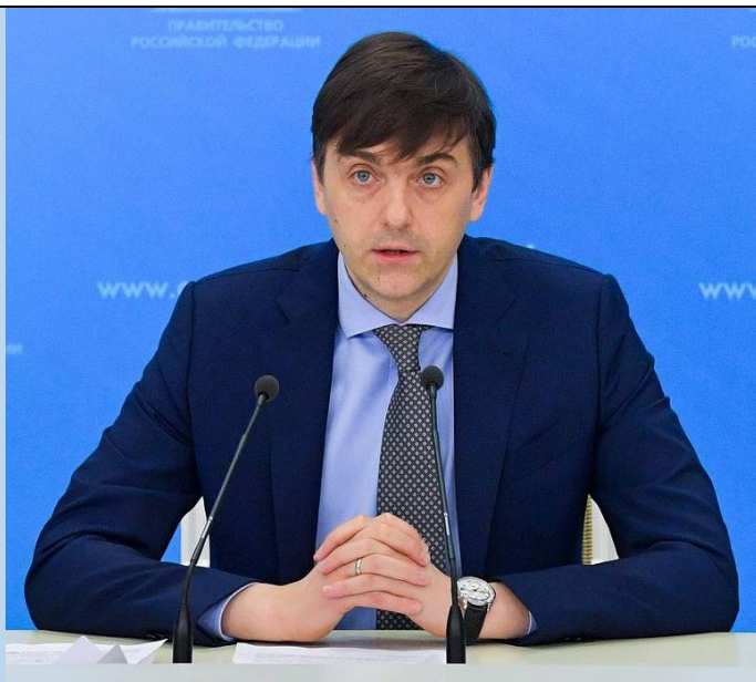
Министр просвещения России, Кравцов Сергей Сергеевич