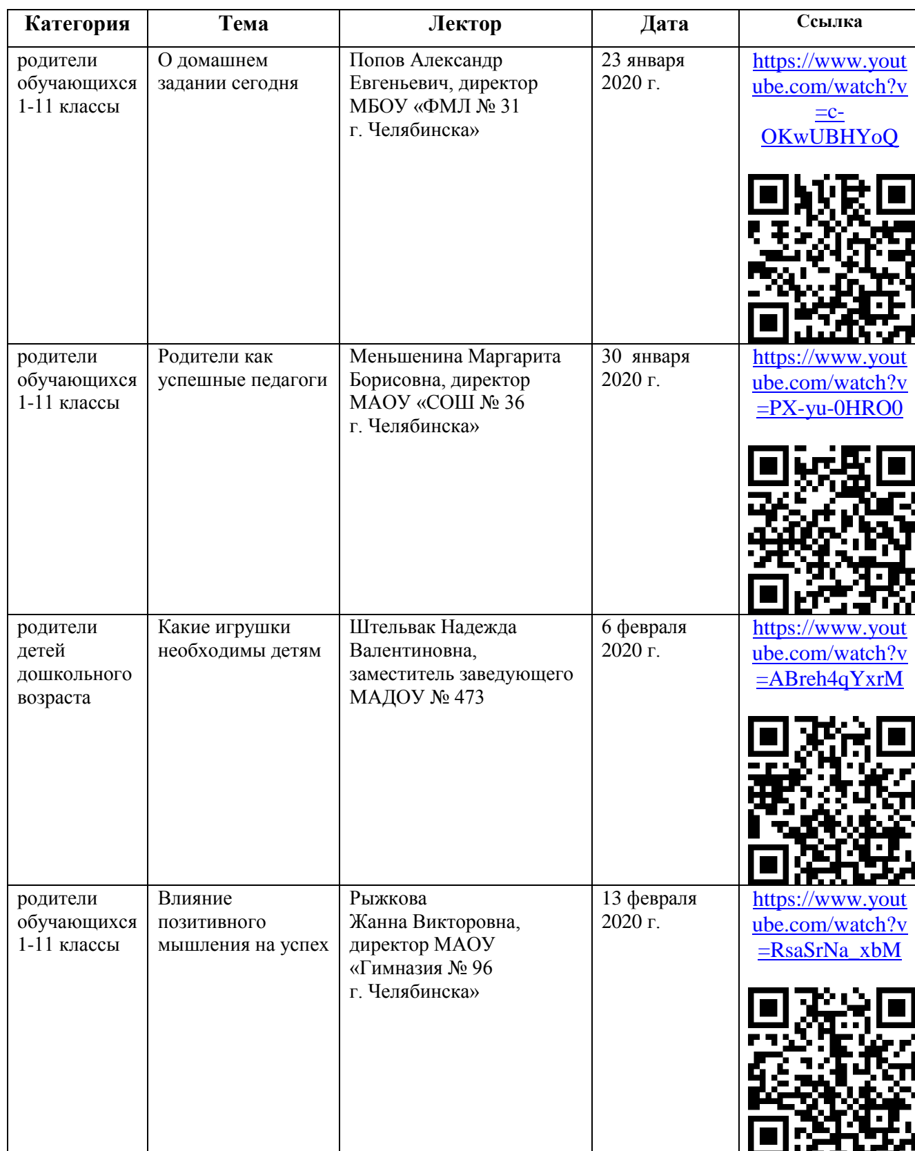
График родительского всеобуча «Стратегия понимания» на январь-февраль 2020 Начало мероприятий в 16–00